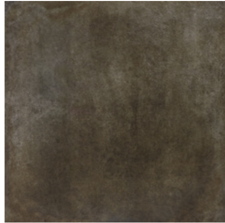
Y-ONE 337 tabak | tobacco | tabac 60 x 60 cm