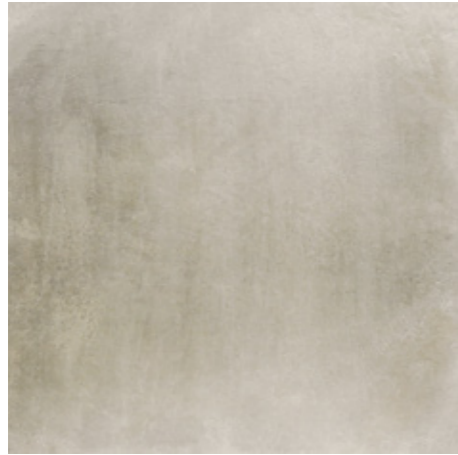
Y-ONE 332 sand | sand | sable 60 x 60 cm