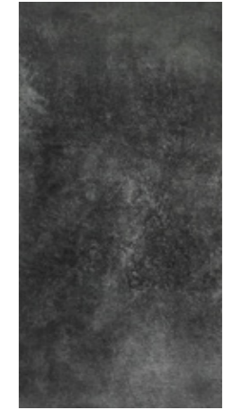
Y-ONE 935 graphit | graphite | graphite 30 x 60 cm

Bodenfliese | porcelain | carreau de sol