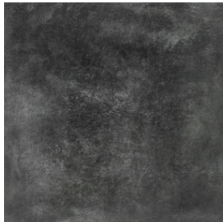
Y-ONE 335 graphit | graphite | graphite 60 x 60 cm