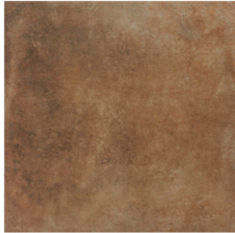
Y-ONE 338 terra | terra | terre 60 x 60 cm