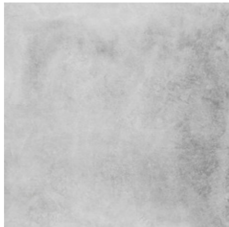
Y-ONE 331 zement | cement | ciment 60 x 60 cm