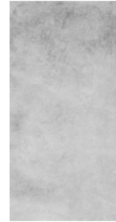
Y-ONE 931 zement | cement | ciment 30 x 60 cm