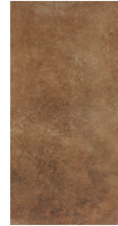
Y-ONE 938 terra | terra | terre 30 x 60 cm