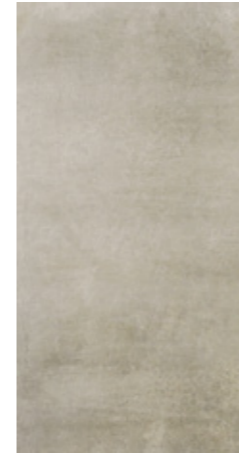
Y-ONE 932 sand | sand | sable 30 x 60 cm