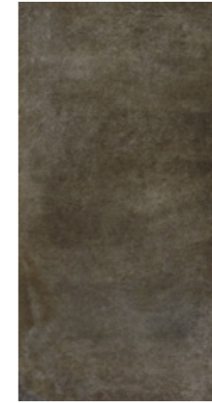
Y-ONE 937 tabak | tobacco | tabac 30 x 60 cm